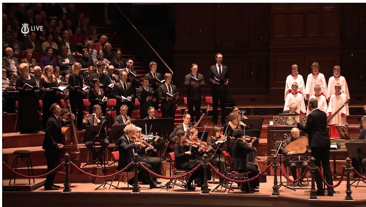
Openingskoor tijdens een uitvoering van de Nederlandse Bachvereniging.